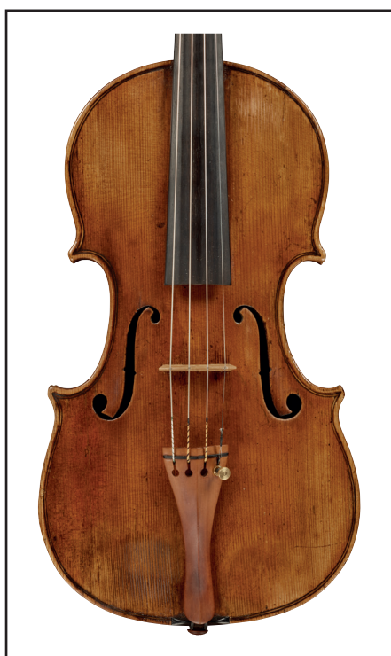
Violine von Giovanni Battista Guadagnini.

Das Beispiel zeigt schon ansatzweise, wie solcherart Sachanlagen funktionieren können und worauf man beim Investment achten sollte. Gesucht und am Markt entsprechend hoch bewertet werden nur sel-